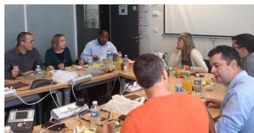
Sensibilisation à la diversité des managers de GRDF