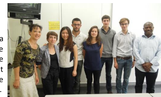
Les étudiants de l'Ecole Centrale de Nantes avec leur évaluatrice et 2 salariés de FACE

FACE Loire Atlantique a assisté en juin à la soutenance des étudiants de 1 ère année de l'Ecole Centrale de Nantes, dans le cadre de leur Projet d'Etudes Industrielles (PEI). L'objet du PEI consistait à travailler sur l'étude de faisabilité d'un réseau social pour l'association.