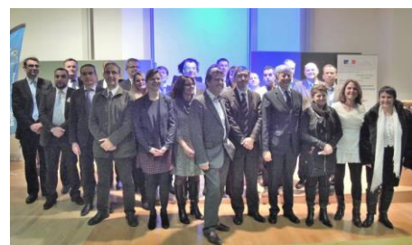
Les signataires de la Charte

Une convention d'objectifs est ensuite signée individuellement avec chaque entreprise.