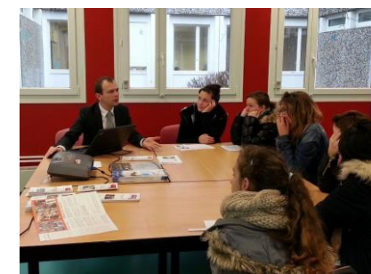
Collège Pierre Norange à Saint-Nazaire

FACE Loire Atlantique permet aux jeunes collégiens de 3 ème et 4 ème scolarisés en Zone d'Education Prioritaire, de rencontrer des professionnels d'entreprise pour éviter une orientation par défaut et favoriser l'accès aux stages par la connaissance des métiers.