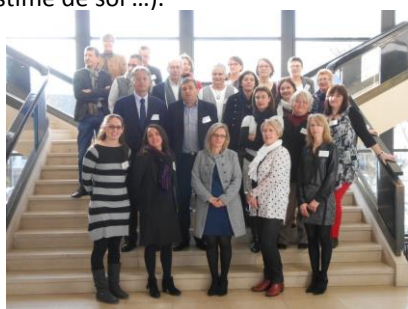
Senior Academy lancée à la Mairie de Saint-Nazaire en décembre. Dans le cadre de la convention triennale entre FACE 44 et la Mairie de Saint-Nazaire

Ces actions obtiennent des résultats intéressants de mise à l'emploi durable grâce à une forte mobilisation des professionnels d'entreprises : parrainage et coaching des candidats, proposition d'offres d'emploi, animations d'ateliers (simulations d'entretien, gestion du stress, estime de soi ...).