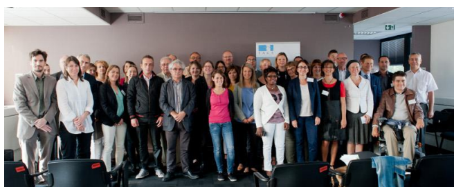
Job H'Academy lancement en septembre à la CNIIEG

124 professionnels sensibilisés et formés à la diversité à travers 8 sessions de formations 490 professionnels présents lors des 9 petits déjeuners et rencontres thématiques.