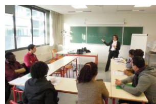
Simulations d'entretiens par la RRH de Veolia auprès de jeunes de la plate forme d'orientation

En 2014 : 284 personnes accompagnées dont 125 en dehors de tout dispositif